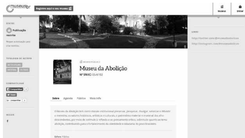
Página eletrônica com informações individualizadas de um museu na Plataforma Museu.br.

“Ainda no contexto das mudanças pelas quais passou o CNM está a sua integração ao Sistema Nacional de Informações e Indicadores Culturais do Ministério da Cultura (SNIIC/MinC). Essa aproximação se iniciou em 2015, revelando uma janela de oportunidade que foi abraçada pela equipe do Cadastro (...).”